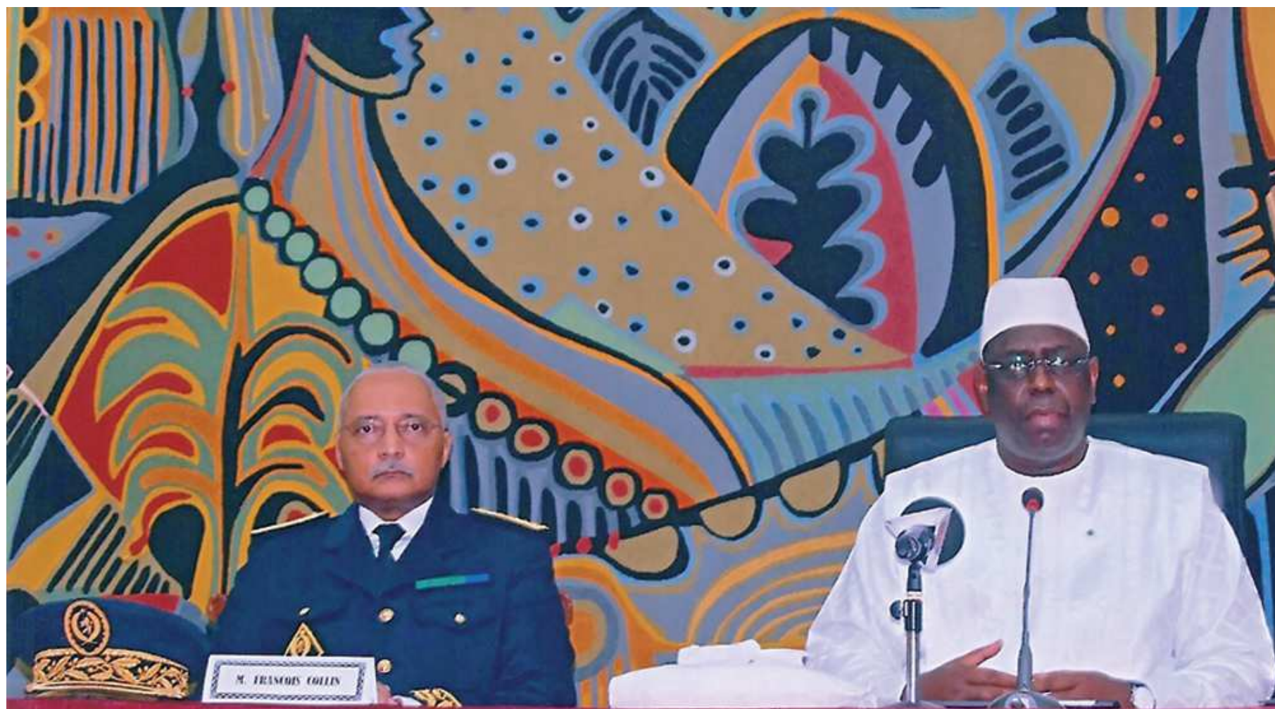
Le Président de la République et le Vérificateur général