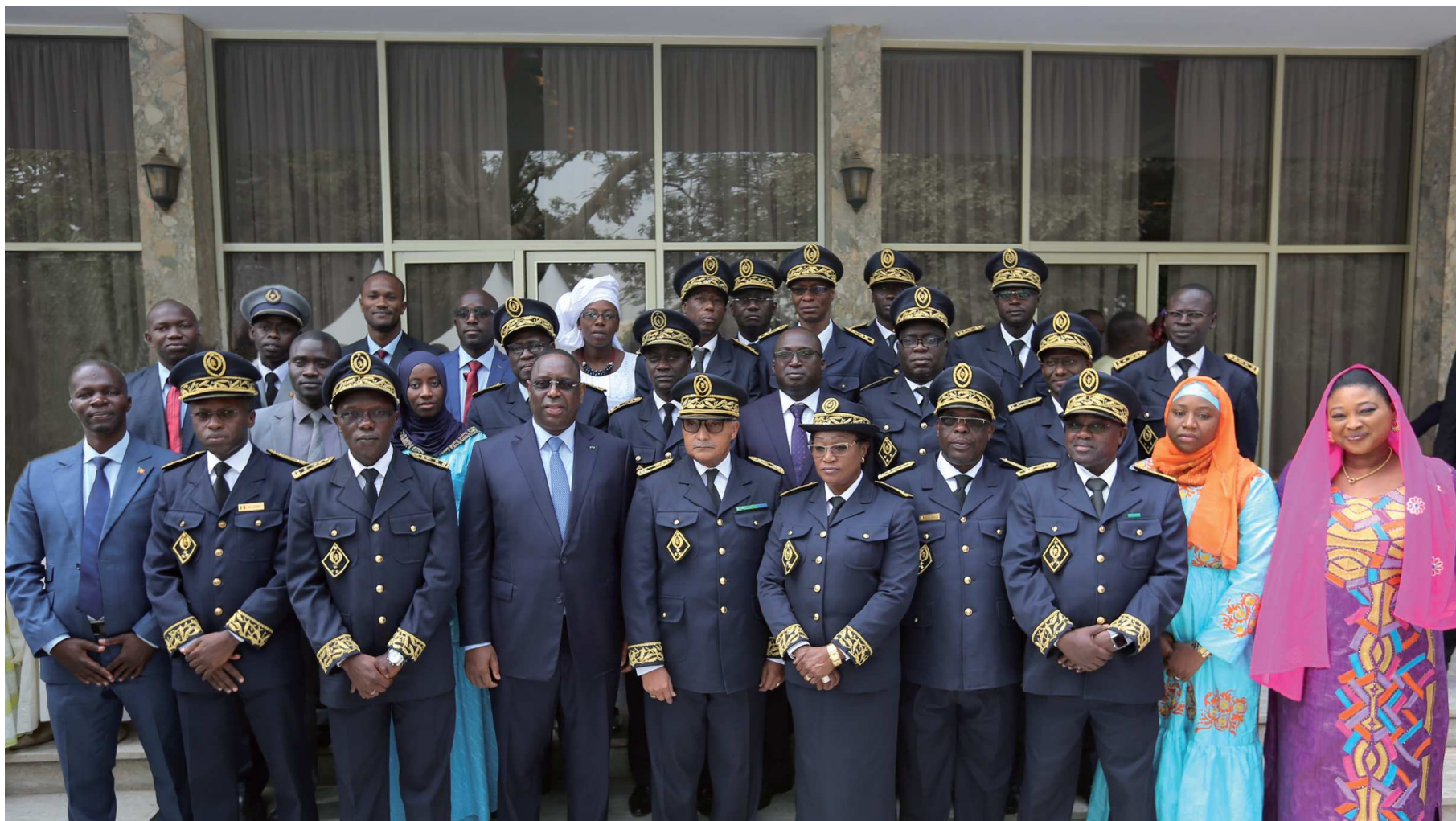
Le Président de la République entouré du Vérificateur général, des Inspecteurs généraux d'Etat, des Assistants de Vérification et de membres du personnel administratif et technique de l'Inspection générale d'Etat