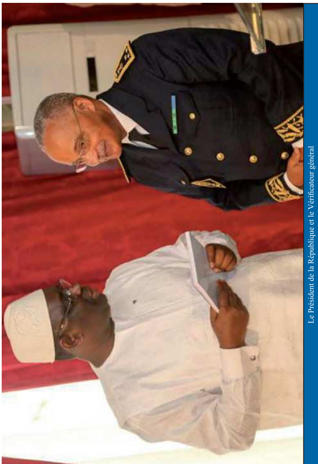
Le Président de la République et le Vérificateur général